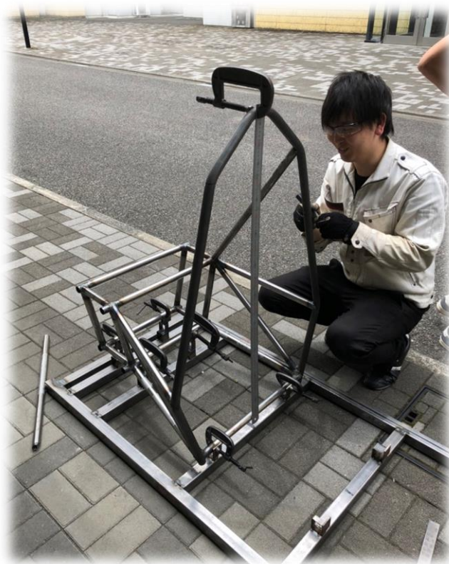
フレーム冶具合わせの様子