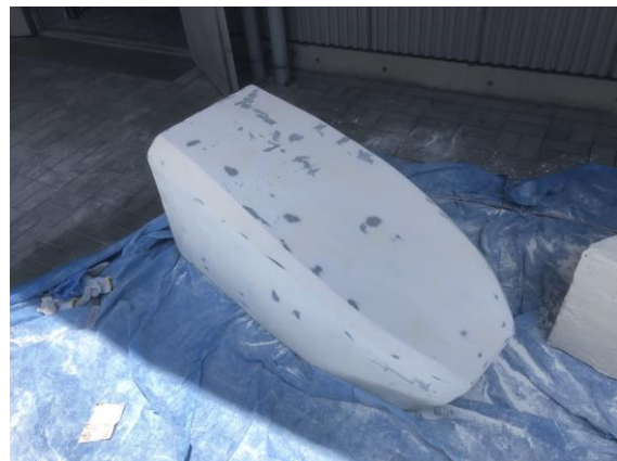
図4 表面処理をしたフロントノーズ