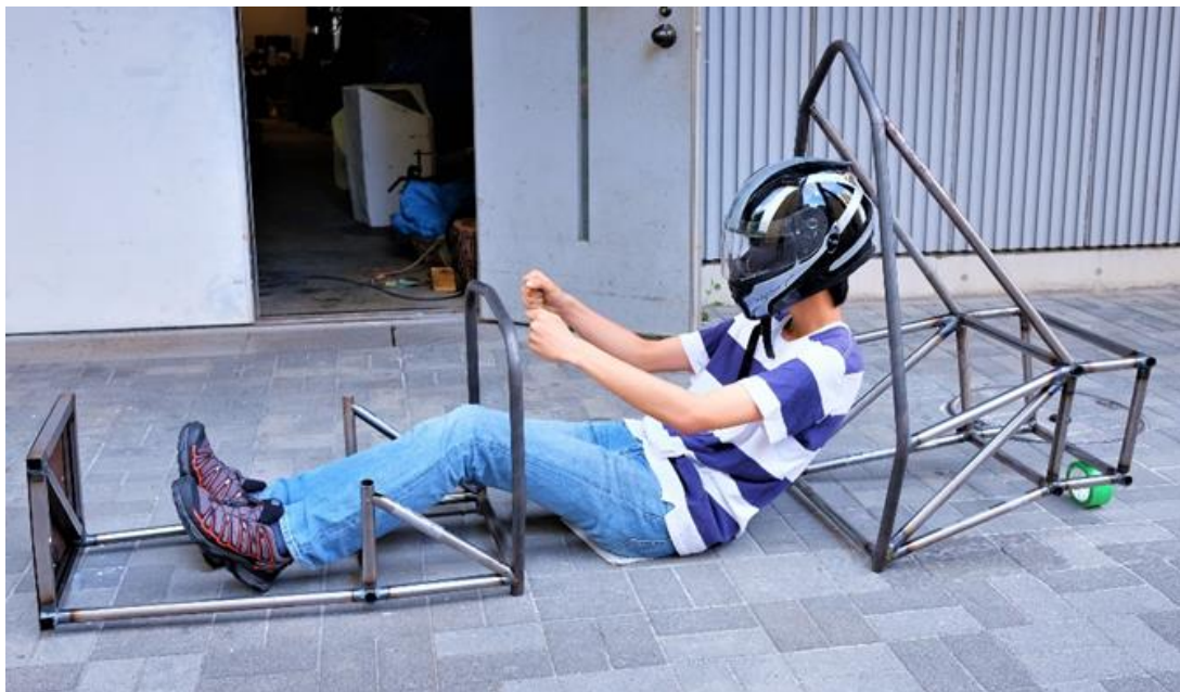
図1 現状のフレーム景観

フロントセクション、リアセクション、サイドインパクトのように、フレームの製作箇所を大まかに3つに分割したうちの、リアセクシ