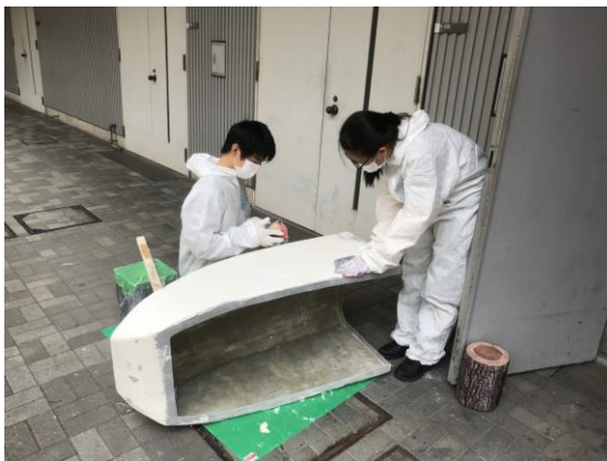
図2 カウル研磨の様子