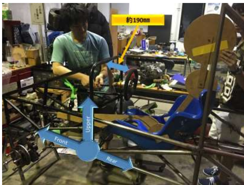
図4 シート固定とステアリング回りの様子

シート固定用のステイが完成しシートを取り付けることができるようになりました。その様子を図4に示します。またステアリングの位置決めも行いました。図5にはパーシーをシートに座らせた状態での側面からの様子を示します。シート回りおよびステアリング回りは静的車検にて精察される箇所の一部であるため、レギュレーションを十分満たすように取り付けていきます。参考資料として図6に先日アップロードされた車検シートの一部抜粋したものを示します。