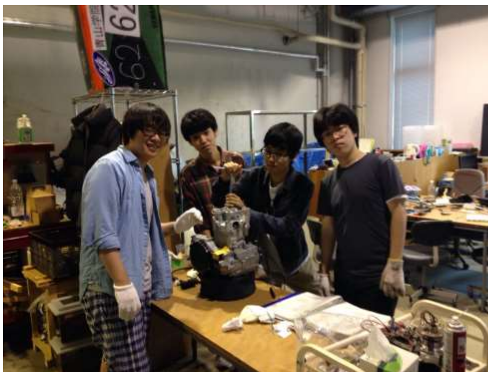
図 7 新入生 4 名(+1 名)

5 人の新入生がチームに加わってくれることとなりました。図 7 に加入してくれた新入生の写真を示します。写真では 4 名しかいませんが他にもう 1 人在籍しております。進んで製作活動に参加してくれています。互いに切磋琢磨、勇猛果敢に学生フォーミュラ活動に励んでいけたらと思っております。