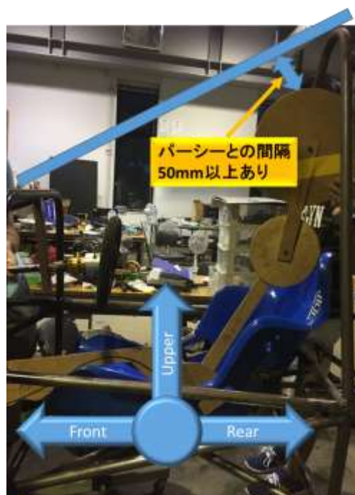
図5 パーシーとの間隔