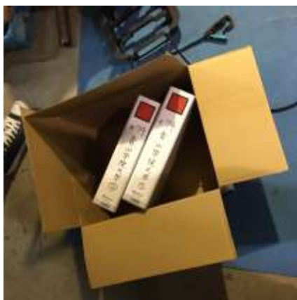
図2 コストレポート提出